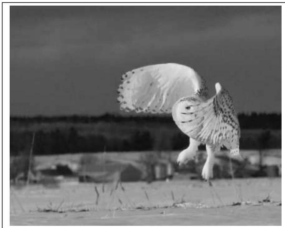
Photo de Françoise Cot, récipiendaire du premier prix au concours de photos amateurs en avril 2011.